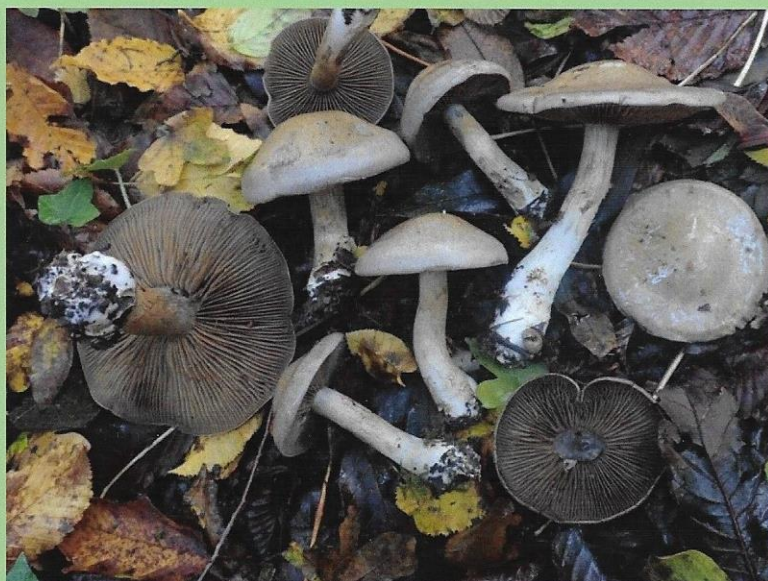
Cortinarius infractus (Persoon) Fries . Marais de Pondron (60), 24/10/2025, lors du stage à Pierrefonds – Photo : Philippe Clowez.

Photo de couverture : Auriscalpium vulgare Gray - Hydne cure-oreilles Forêt domaniale de Laigue, Tracy-le-Mont (60), 25/10/2025, stage Pierrefonds - Auteur : Philippe Clowez