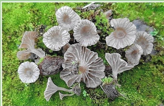
Arrhenia elegans (Pers.) Redhead, Lutzoni, Moncalvo & Vilgalys, 2002 Cimetière de Gomiécourt (62) le 25/11/2021 - Photo C.Lécuru

Photo de couverture : Leucocortinarius bulbiger (Alb. & Schwein. : Fr.) Singer – Beaumont-Hamel 2024 Auteur : C.Lécuru