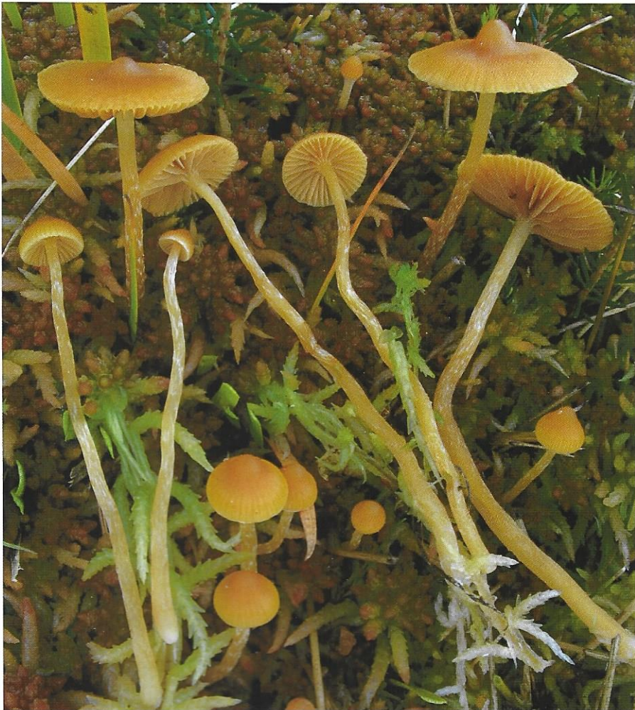
48 Galerina gibbosa J. Favre nom. nud.