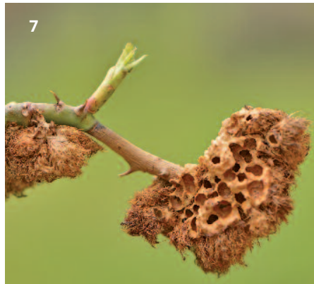
Pl. 1 — Le bédégar.

2 — Bédégar en été sur Rosa canina . 3 — Coupe de bédégar montrant des loges larvaires : une larve par loge entourée du tissu nourricier. 4 — Bédégar sec en fin d'hiver. 5 — Coupe d'une galle en hiver : elle contient des nymphes dans leurs loges. 6 — Un aspect de la bio-cénose du bédégar : à gauche trois Diplolepis rosae et à droite quatre petits hyménoptères « colocataires ». 7 — Coupe de bédégar vidé de ses occupants (mi-mars).